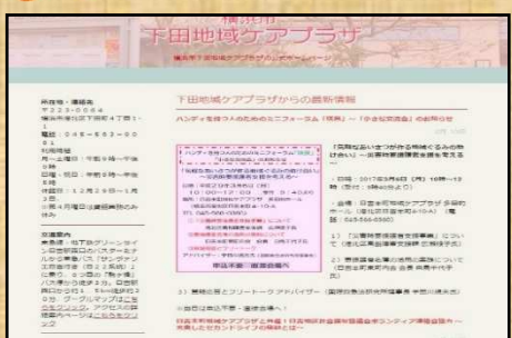
(トップページより)

ケアプラザの事業やサービス・イベント情報など地域の方に情報を発信していきます。パソコンやスマートフォンからもご覧になれます。