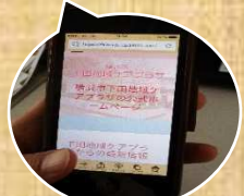
スマートフォンから でも見やすい画面

ケアプラザの事業やサービス・イベント情報など地域の方に情報を発信していきます。パソコンやスマートフォンからもご覧になれます。